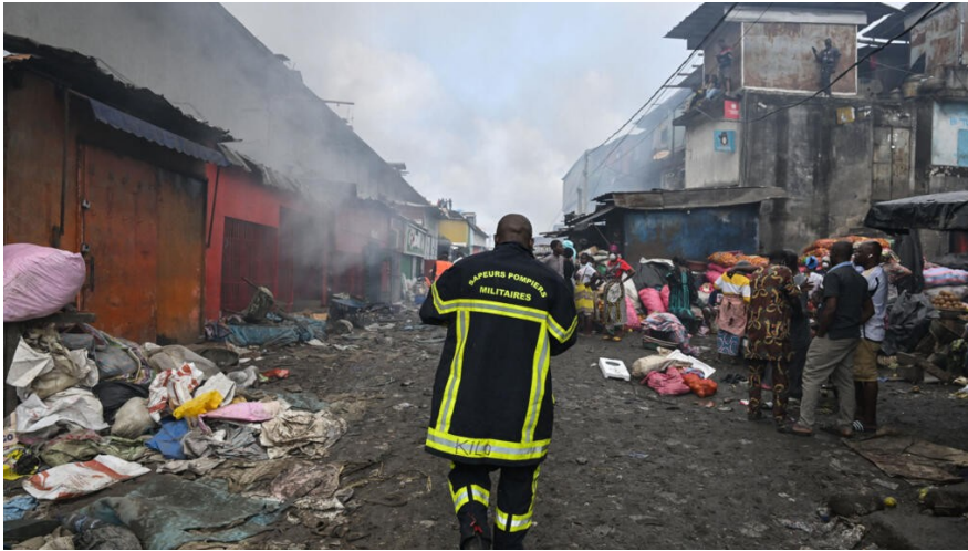
Photo 3 : Un pompier au milieu d'une allée du marché d'Adjamé d'Abidjan partiellement détruit après l'incendie qui s'est déclaré le 15 août 2024