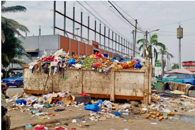
Photo 2 : Une vue du marché de Yopougon, quartier France Afrique étouffé par les ordures

dédiées à la vente de denrées alimentaires. Ces déficiences exposent tant les commerçants que les usagers à d'importants risques sanitaires, aggravés en période de pluies, où les inondations récurrentes rendent certaines zones inaccessibles et favorisent la prolifération de maladies d'origine hydrique.