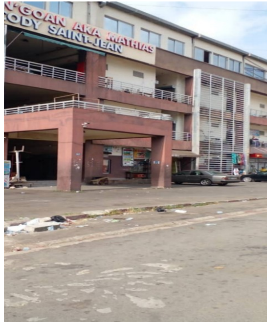
Photo 1 : Une vue d'un marché moderne dans la commune de Cocody : marché N'Goan Mathias à Saint-Jean