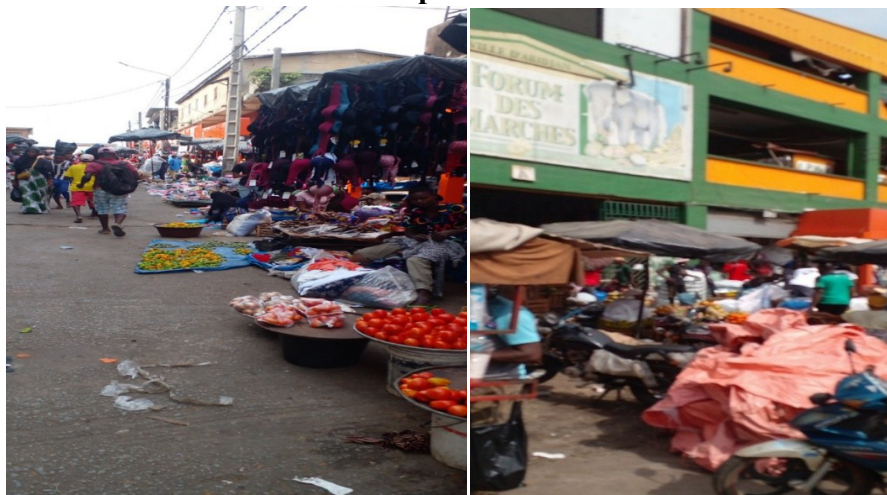
Planche 1 : Une vue du marché forum dans la commune d'Adjamé débordant de sa sphère